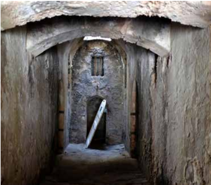
Citadelle de Marseille