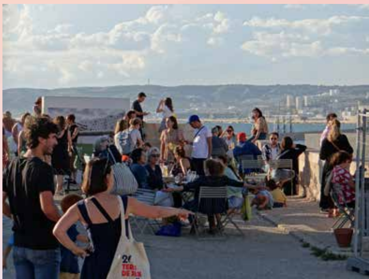
Citadelle de Marseille

Pour déjeuner au calme, se détendre en famille le weekend, sécher au soleil après une baignade aux Catalans ou un apéro entre amis, rendez-vous à la Guinguette du fort !